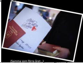
(Samma som förra året...)

1 maj, Ludvika: Vi gestaltar en annan berättelse